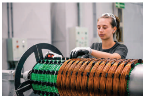
Produção de equipamentos elétricos aumentou 6,4% no mês de abril.